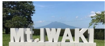
平川市・猿賀公園 【7月27日～8月21日】