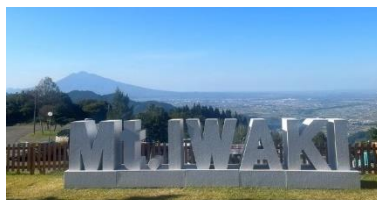
大鰐町・青森ワイナリーホテル 【9月14日～10月3日】