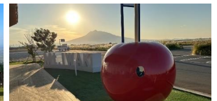
藤崎町・ふじさき食彩テラス 【10月4日～11月5日】