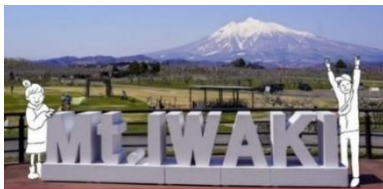
弘前市・弘前市りんご公園 【3月31日～7月2日】 【11月1日～11月27日】

「Mt.IWAKI モニュメント」が津軽 14 市町村の岩木山が見える 6 地点への移動を終え、スタート地の弘前市りんご公園へ戻ってきました。 ご協力いただきました自治体の皆さま、本当にありがとうございました！