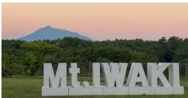
五所川原市・楠美家住宅 【8月22日～9月13日】