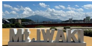
鱒ヶ沢町・はまなす公園 【7月3日～7月27日】