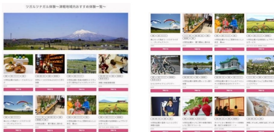
※HP より抜粋。一部の商品となります。